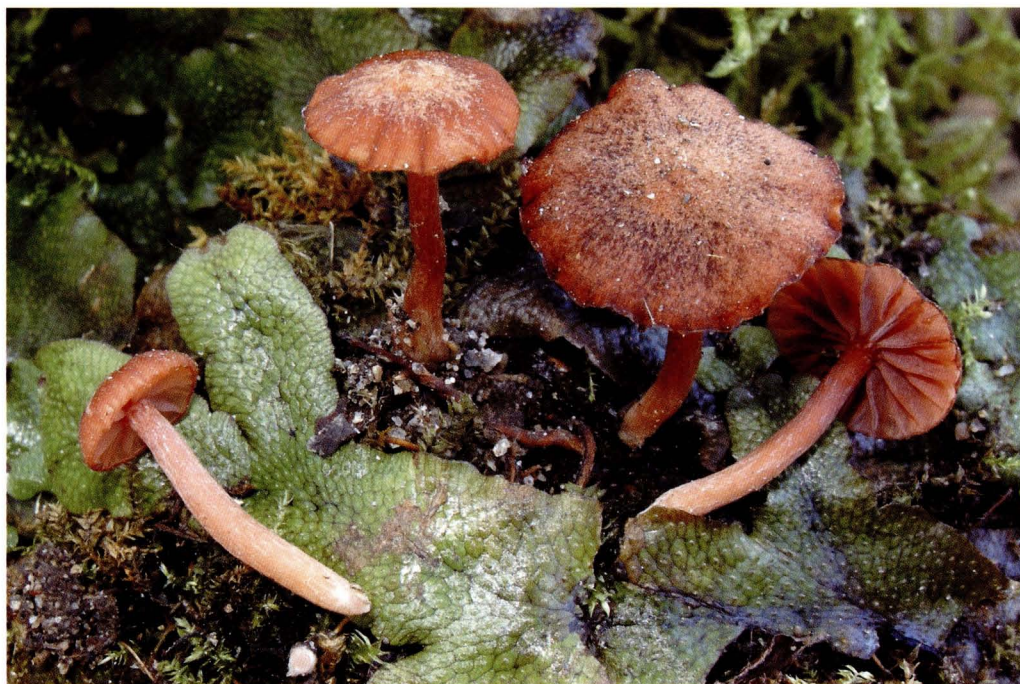
Laccaria pumila (PG171107-2).