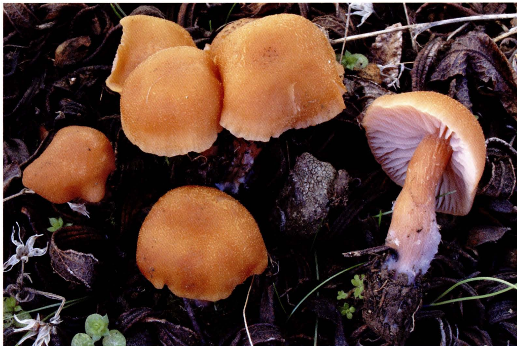
Laccaria trichodermophora